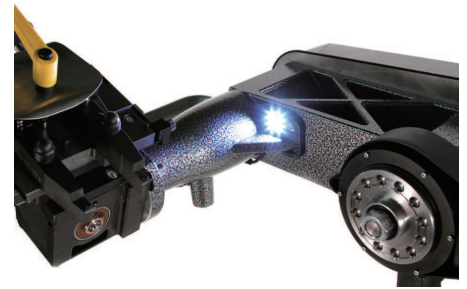
高輝度6LEDを組み込んだ高剛性Xフレーム